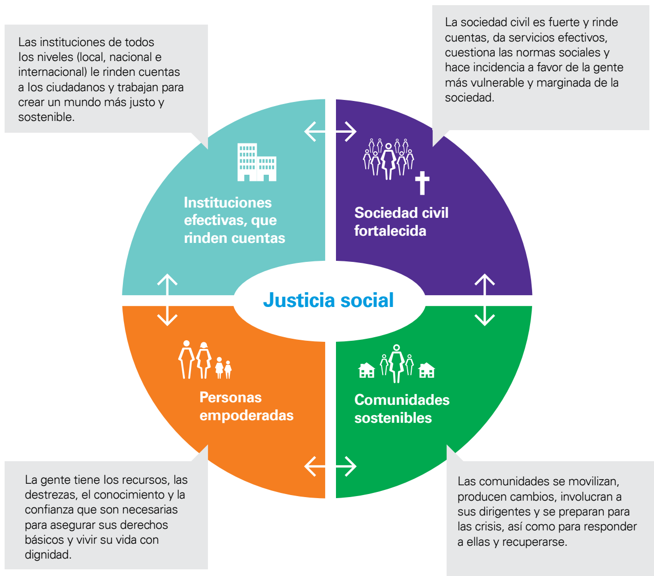
Figura 1: El cambio a que aspiramos junto con nuestras organizaciones socias:

por su género, edad, discapacidad, origen étnico, raza o cualquier otra razón. Ello coincide con los principios de «No dejar a nadie atrás», como se les presenta en los Objetivos de Desarrollo Sostenible (ODS).