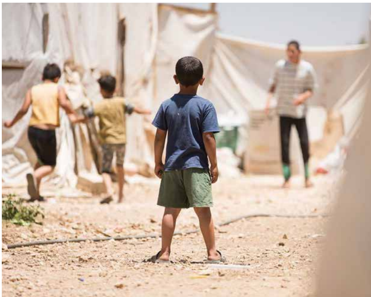
Niños que juegan en un campo de refugiados del valle de la Becá, en el Líbano.