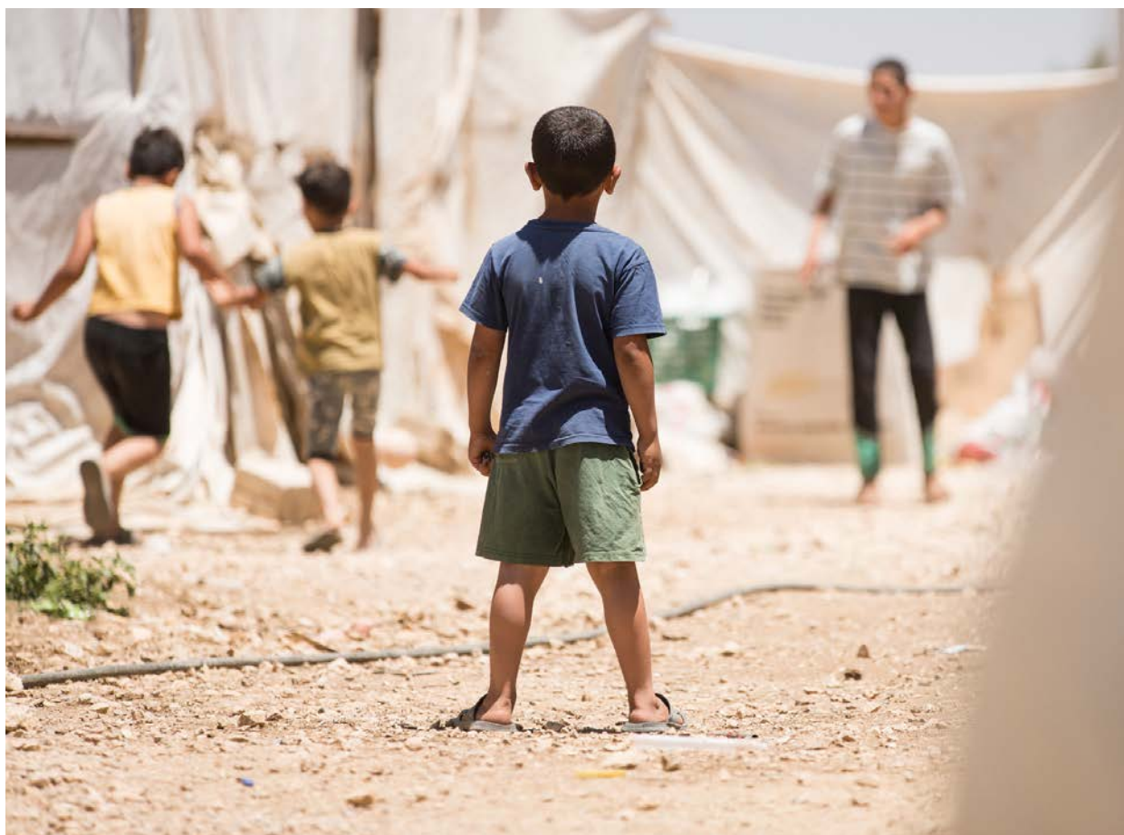
Les enfants jouant dans un camp de réfugiés dans la vallée de Beqaa au Liban.